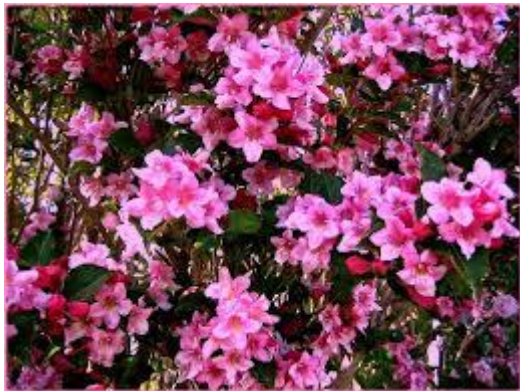
Exempel på buskar mot gångvägar