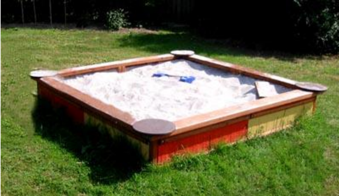
Lekplats med bla sandlåda centralt i området