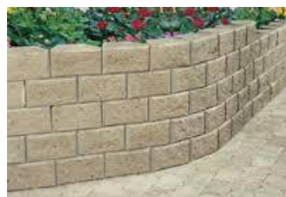
Exempel på stödmur

Lekplats för de mindre barnen skall anläggas centralt i området, utrustas med sandlåda och ytterligare ett lekredskap. På naturmarken ovanför de övre husen finns gott om plats för byggande av kojor och dylikt.