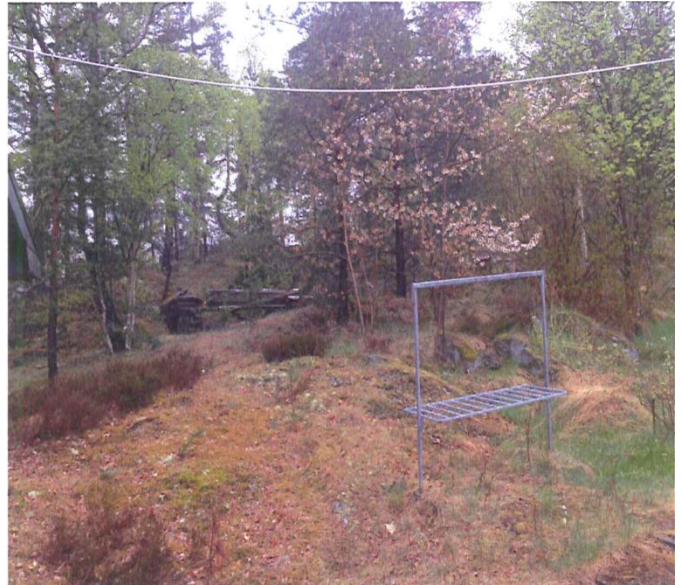
Naturmark på Kumla 3:242