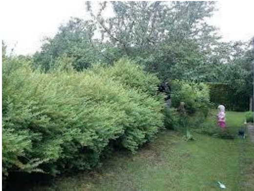
Exempel på häck mot Malmstigen.