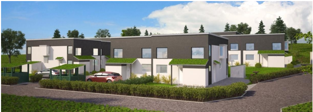
Vy från Malmstigen