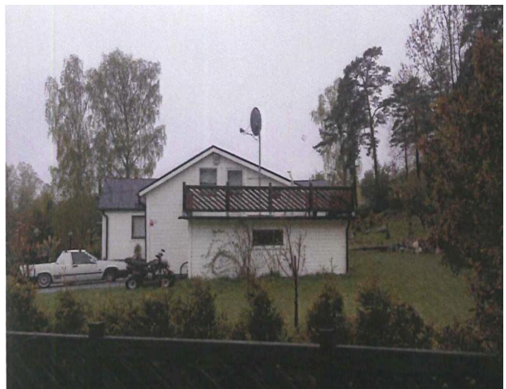
Befintlig bebyggelse på Kumla 3:245