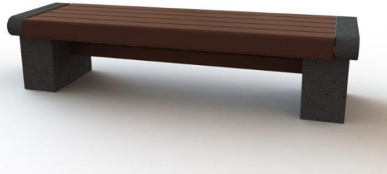
Exempel på parkbänk vid lekplatsen.