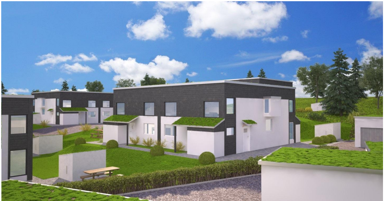
Vy mot parhusen, sett från carportlänga