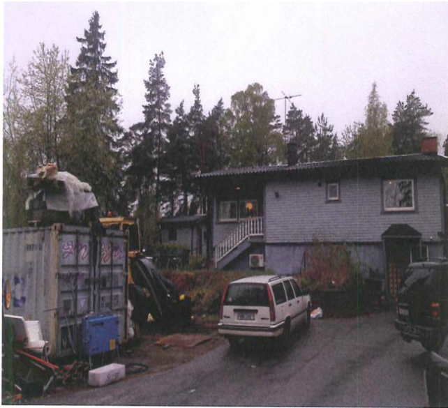
Befintlig bebyggelse på Kumla 3:242