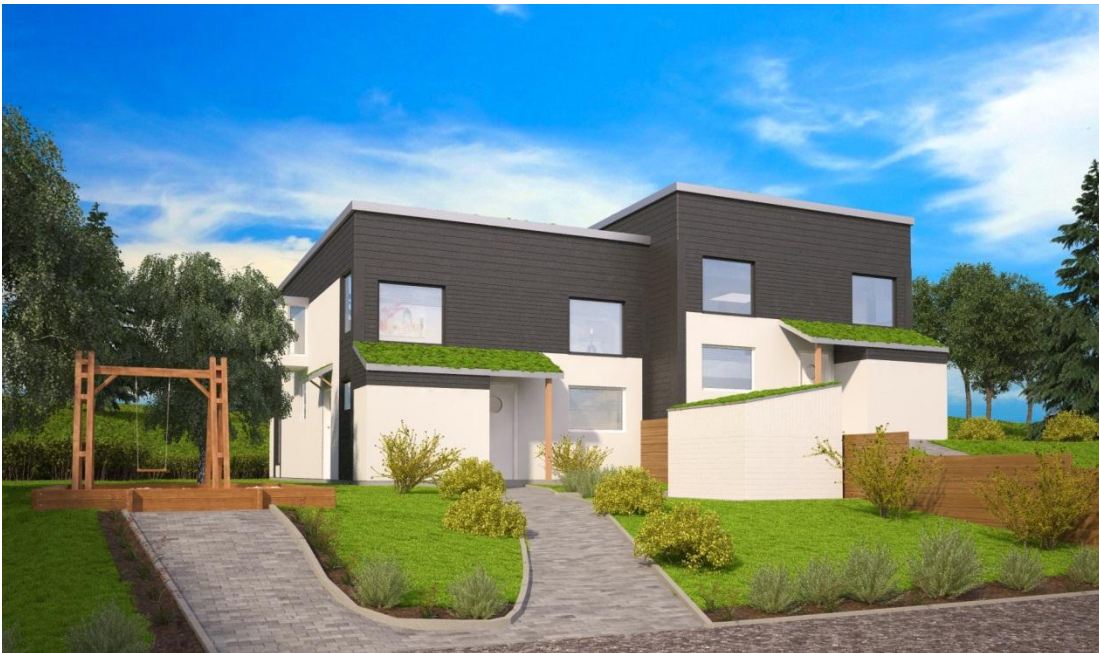
Entré souterränghusen, med gemensam lekplats bredvid