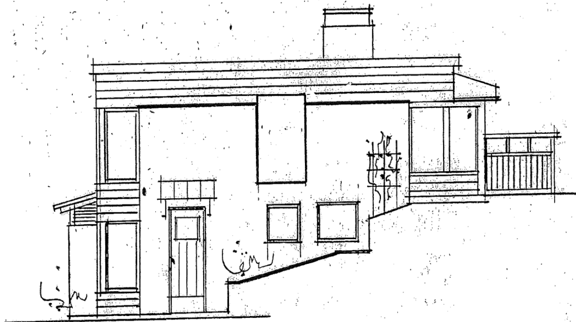
Gaveln på souterränghuset

Parhusen uppförs i två plan med liggande träpanel i mörk nyans med inslag av putsytor i ljusare kulör och med sedumtak. De två husen längst till väster, som placeras på kuperad mark, ska byggas i souterräng. Byggnaderna utformas med ett enkelt formspråk.