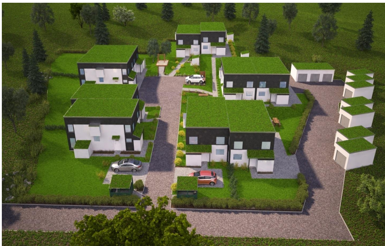
Översiktbild över Kumla 3:245 samt 3:242, sedd från öster

Tillhörande detaljplan för fastigheterna Kumla 3:242 och 3:245, Malmstigen nr 1 och 3, Tyresö kommun, Stockholms län